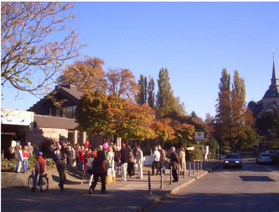
Sandhäuschen Oktober 2007